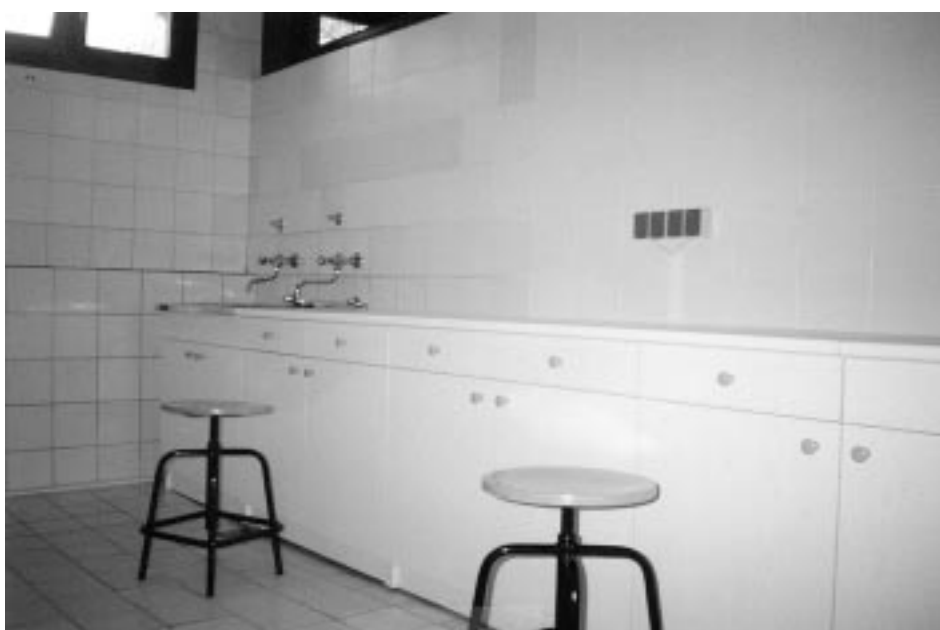
Sala rehabilitada al Laboratori Galènic de Tuzla.