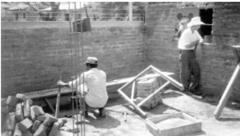
Brigades de treball en la construcció de cases a San Juan de Limay.