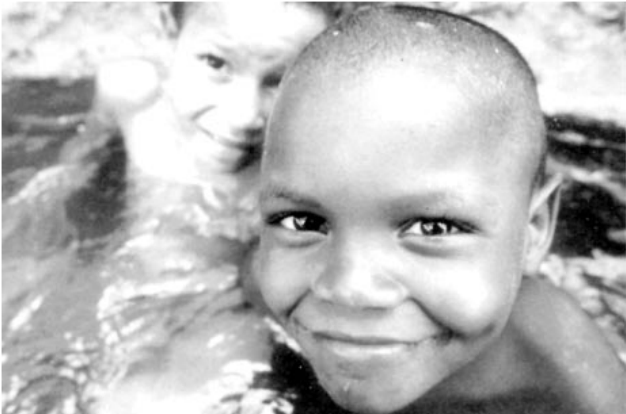
Imatge de portada de la guia de l'exposició Una mirada al món.

Aquesta exposició es va presentar a l'Assemblea General de Socis celebrada a Viladecans el passat mes de març i durant l'any 2000 s'ha exposat a un total de 22 municipis catalans, en alguns casos acompanyada d'una conferència inaugural. Els municipis que l'han exposat són: Lleida, Rubí, Castellar del Vallès, Viladecans, Santa Coloma de Gramenet, Cerdanyola del Vallès, Molins de Rei, Sant Vicenç de Castellet, Castelldefels, Vilafant, l'Escala, Arenys de Mar, Banyeres del Penedès, Calafell, Perelada, Palafrugell, Tortosa, Vilanova i la Geltrú, Llagostera, Lliçà d'Amunt, Reus i Santa Eulàlia de Ronçana.