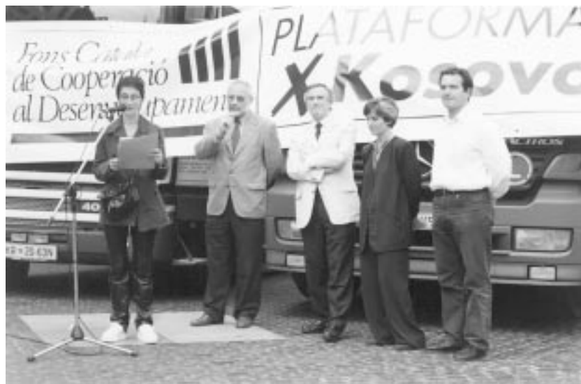
Sortida a Barcelona del material de la Campanya x Kosovo.

projectes de reconstrucció tant física com social a Kosovo i a Albània. Totes les accions endegades han estat recollides en la memòria publicada l'any 2000, que està a disposició de tots els socis i col·laboradors.