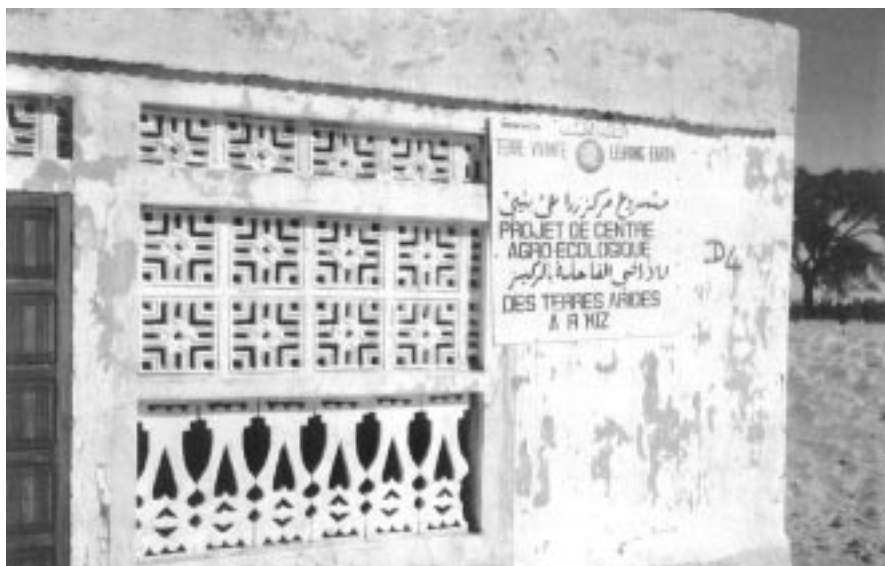
Centre Agroecològic des Terres Arides à R'kiz, sud-est de Mauritània.

AJUNTAMENT DE MOLLET DEL VALLÈS AJUNTAMENT DE SANT JUST DESVERN