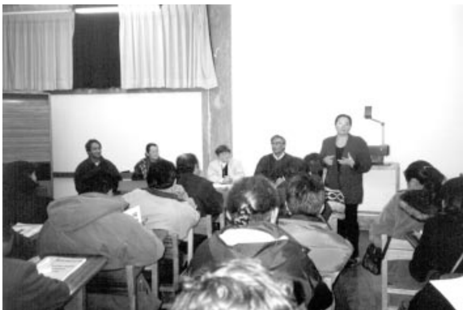
Taller de gestió urbana a l'Escola de Formació Municipal i Ciutadana, Perú.