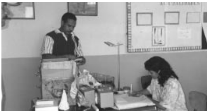
Lliurament de material escolar pels infants del barri de San Bernardino a Caracas.