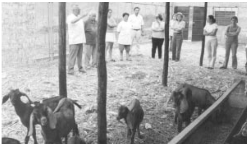
Corrals per a la ramaderia en la Central de Capacitació de Alta Huaral a Perú.