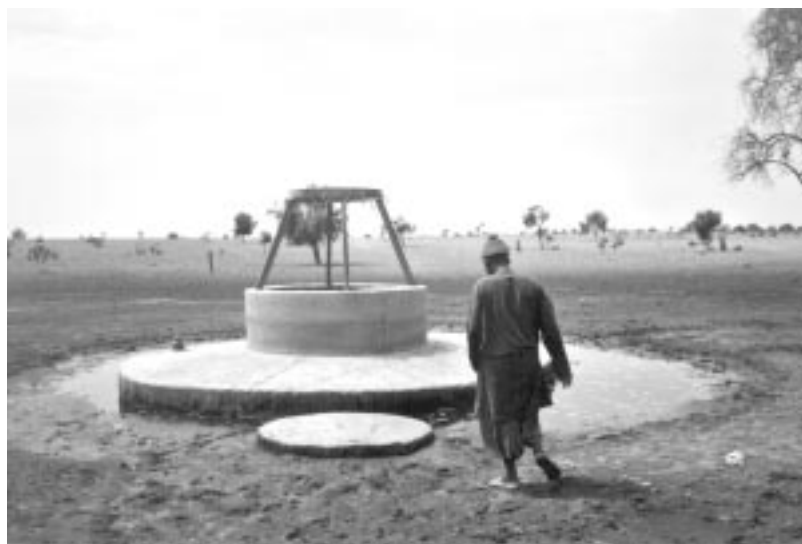
Excavació d'un pou a Ndiossy, al nord del Senegal.

AJUNTAMENT DE SANT LLORENÇ SAVALL AJUNTAMENT DE TORRELLES DE LLOBREGAT MANCOMUNITAT DE MUNICIPIS DE L'ÀREA METROPOLITANA DE BARCELONA