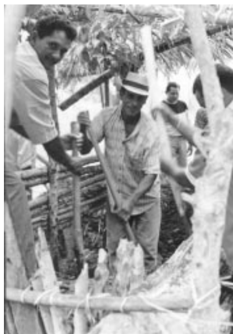
Procés de construcció del molí comunitari a San Bernardo del Viento, Colòmbia.

AJUNTAMENT D'AVINYONET DEL PENEDES AJUNTAMENT DE BREDÀ AJUNTAMENT DE CELRÀ AJUNTAMENT DE SALOU AJUNTAMENT DE SANT FELIU DE PALLEROLS AJUNTAMENT DE SANT LLORENÇ D'HORTONS AJUNTAMENT DE TOSSA DE MAR AJUNTAMENT DE VACARISSES