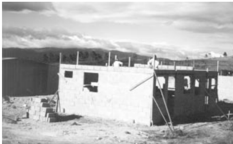
Construcció d'habitatges al departament de Francisco Morazán, Honduras.

AJUNTAMENT DE L'ESCALA AJUNTAMENT D'ESPLUGUES DE LLOBREGAT