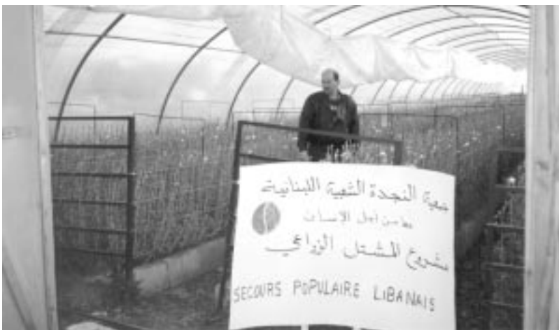
Planters de repoblació de cultius al Líban.

IRTA – INSTITUT DE RECERCA I TECNOLOGIA AGROALIMENTÀRIES