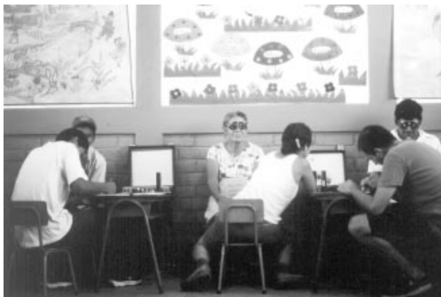
Exàmens optomètrics a la població de Tecoluca, El Salvador.