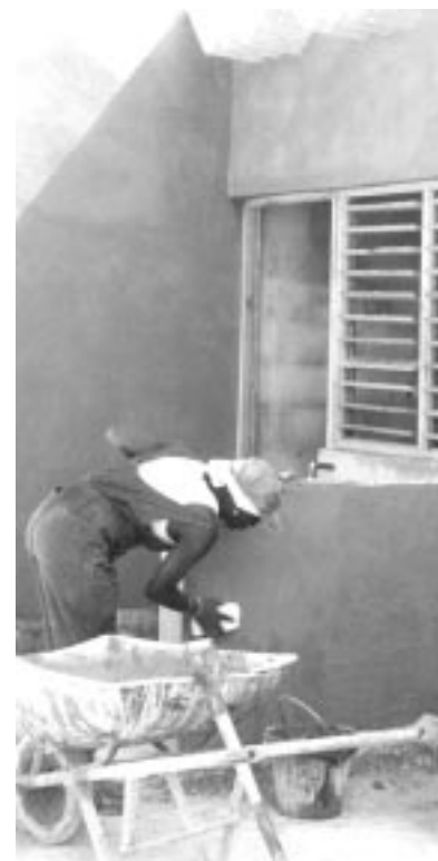
Edificació d'habitatge per a nuclis familiars a la província de Ciudad Habana.

MANCOMUNITAT DE MUNICIPIS DE L'ÀREA METROPOLITANA DE BARCELONA