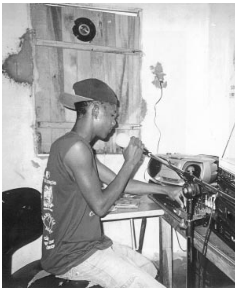
Locutori de Ràdio Comunitària Avante Lençóis, a Chapada Diamantina, Brasil.