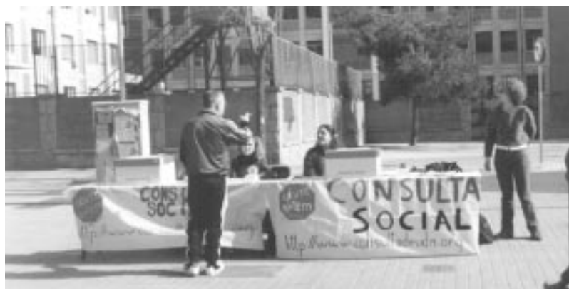
Taula de votació de la Consulta Social per l'Abolició del Deute Extern.