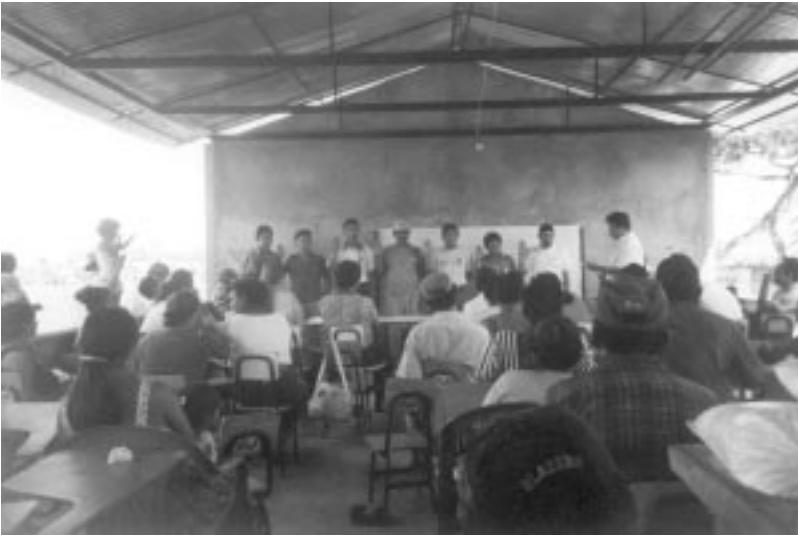
Taller de formació de la cooperativa de la comunitat Nuevo Horizonte a Guatemala.