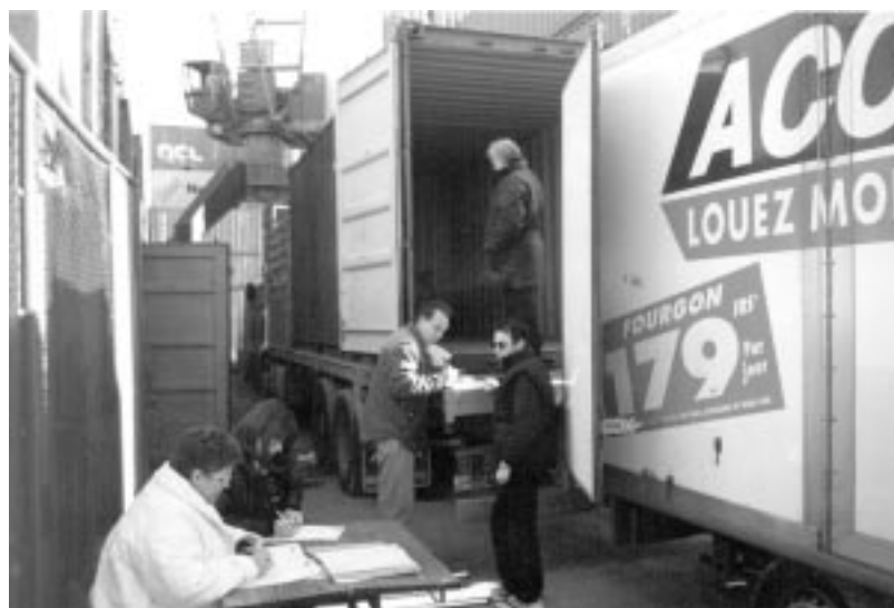
Enviament de materials i vehicles des del port de Barcelona i Tarragona.

AJUNTAMENT DE SANTA COLOMA DE GRAMENET AJUNTAMENT DE VILADECANS AJUNTAMENT DE VILANOVA I LA GELTRÚ DIPUTACIÓ DE GIRONA