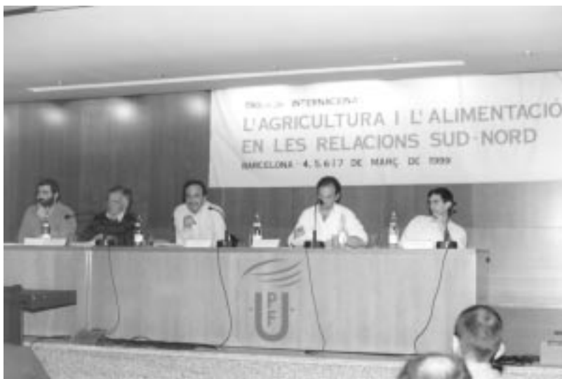
Trobada Internacional sobre l'Agricultura i l'Alimentació en les relacions Nord - Sud a Barcelona.