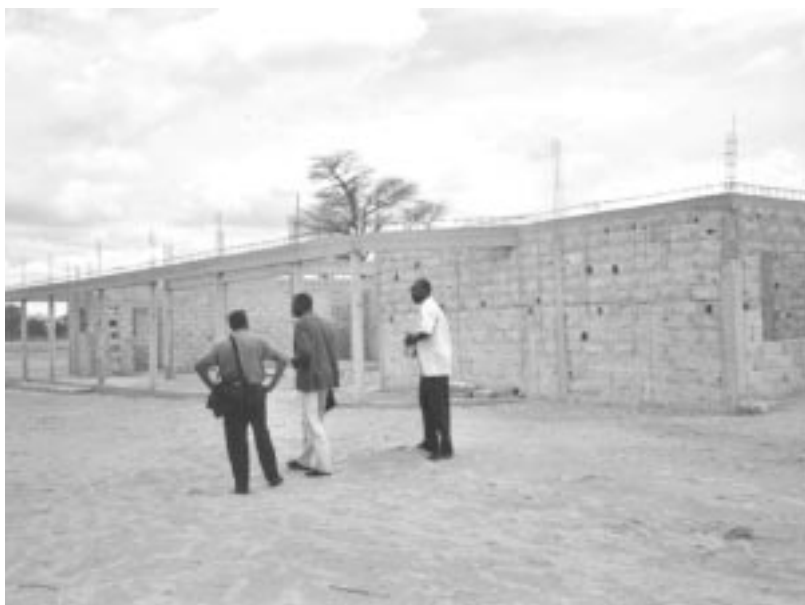
Obres de construcció del futur Centre Polivalent a Niakhar, Senegal.

COMITÈ D'EMPRESA I JUNTA DE PERSONAL DE L'AJUNTAMENT DE CASTELLDEFELS