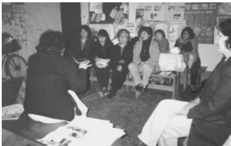
Reunió del Club de Mares, beneficiàries de la construcció del menjador a Santa Isabel de Villa a Perú.

AJUNTAMENT DE BLANES AJUNTAMENT DE CASTELLÓ D'EMPÚRIES AJUNTAMENT DE CORNELLÀ DEL TERRI AJUNTAMENT DE CREIXELL AJUNTAMENT DE FLAÇA AJUNTAMENT DE LA GRANADA AJUNTAMENT DE LES LLOSSES AJUNTAMENT DE PALAFOLLS AJUNTAMENT DE REUS AJUNTAMENT DE SANT JOAN LES FONTS AJUNTAMENT DE SANTA COLOMA DE FARNERS AJUNTAMENT DE SANTA MARIA D'OLO AJUNTAMENT DE SANTA PERPÈTUA DE MOGODA AJUNTAMENT DE VILASSAR DE MAR