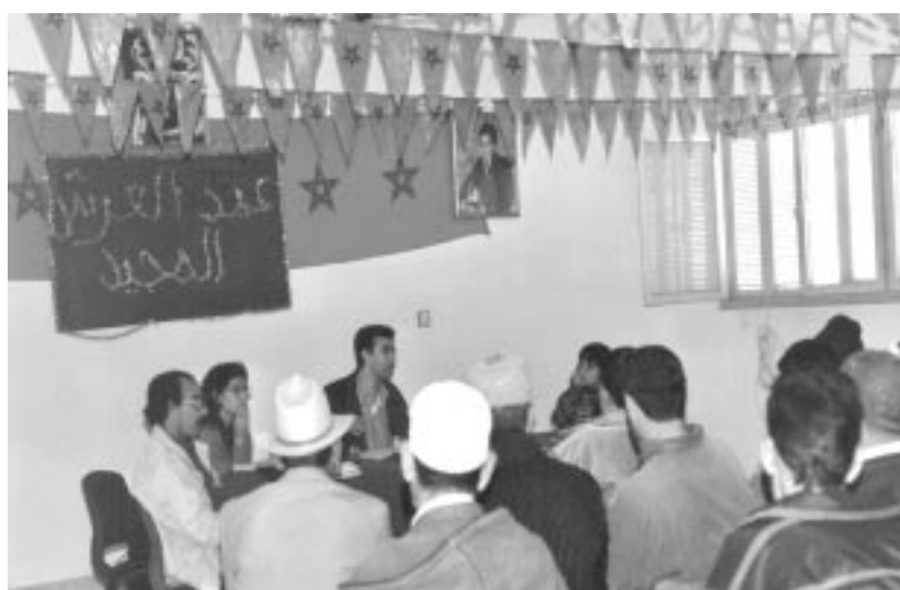
Reunió del col·lectiu beneficiari del projecte a Tamassint, Marroc.

FONS MALLORQUÍ DE SOLIDARITAT I COOPERACIÓ